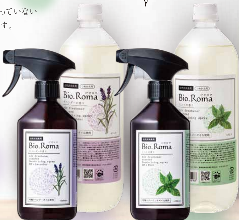
<ラベンダーの香り>